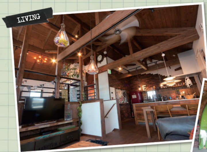
スキップフロアが生み出す、ワクワクのリビング。家族が自然と集まり、コミュニケーションもふかまります。