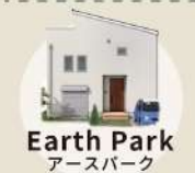
Earth Park アースパーク